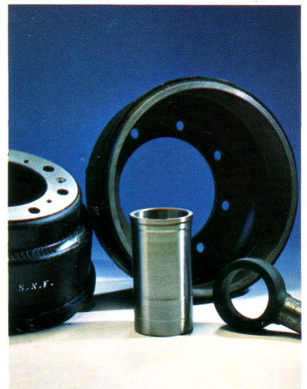
ผลิตภัณฑ์เหล็กหล่อ

การจำหน่ายผลิตภัณฑ์ซีเมนต์ใยหิน ของบริษัทกระเบื้องกระดาศไทย จำกัด มี ปริมาณสูงขึ้นร้อยละ 4 และคิดเป็นมูลค่าสูงขึ้นร้อยละ 14 จากปีที่แล้ว สำหรับ ผลิตภัณฑ์กระเบื้องจำหน่ายได้สูงขึ้นคิดเป็นมูลค่าร้อยละ 18 แต่การจำหน่ายท่อ ซีเมนต์ใยหินลดลงเล็กน้อย เนื่องจากการดำเนินงานตามโครงการของการประปา นครหลวงและการประปาส่วนภูมิภาค ซึ่งเป็นลูกค้ารายใหญ่ของบริษัทล่าช้ากว่าที่ กำหนดไว้ ในด้านราคากระเบื้องปี 2522 นี้ ทางราชการได้อนุมัติให้มีการปรับราคา ผลิตภัณฑ์กระเบื้องใยหิน 2 ครั้ง เพื่อชดเชยต้นทุนการผลิตที่สูงขึ้น