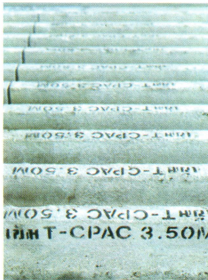
เสาเข็มคอนกรีตอัดแรงรูปตัวทีของซีแพค