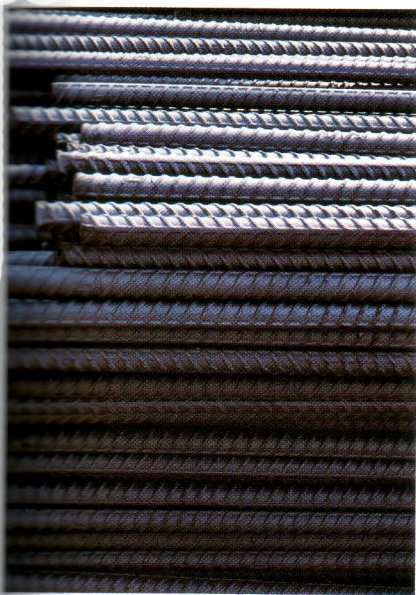
เหล็กเส้นของบริษัทเหล็กสยาม จำกัด

การจำหน่ายอิฐทนไฟซึ่งผลิตโดยบริษัทปูนซิเมนต์ไทย จำกัด ปริมาณการจำหน่ายเพิ่มขึ้นจากปีก่อนร้อยละ 14 คิดเป็นมูลค่าสูงกว่าปีก่อนร้อยละ 19 ทั้งนี้โดยบริษัทพยายามมุ่งสนองความต้องการของตลาดสินค้าที่มีคุณภาพสูงและลดการผลิตสินค้าคุณภาพต่ำลง ผู้ซื้อรายใหญ่ได้แก่โรงงานซีเมนต์และโรงงานเหล็กทั้งในประเทศและต่างประเทศ โดยเฉพาะประเทศในกลุ่มอาเซียน คือ สิงคโปร์ อินโดนีเซีย ฟิลิปปินส์ และมาเลเซีย