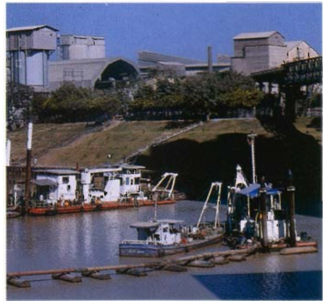
โรงงานปูนซีเมนต์ท่าหลวง จ.สระบุรี ประสานงานกับกรมเจ้าท่า ในการขุดลอกร่องน้ำป่าสักเพื่อความสะดวกรวดเร็วในการขนส่งปูนซีเมนต์ทางน้ำ มีกำหนดแล้วเสร็จในปี 2537

ทางด้านบริษัทผลิตภัณฑ์และวัตถุดิบก่อสร้าง ได้เพิ่มจำนวนโรงงานผลิตคอนกรีตผสมเสร็จ รถโม้ โรงงานผลิตทราย และทาวเวอร์แพลนท์ เพื่อให้สามารถบริการลูกค้า