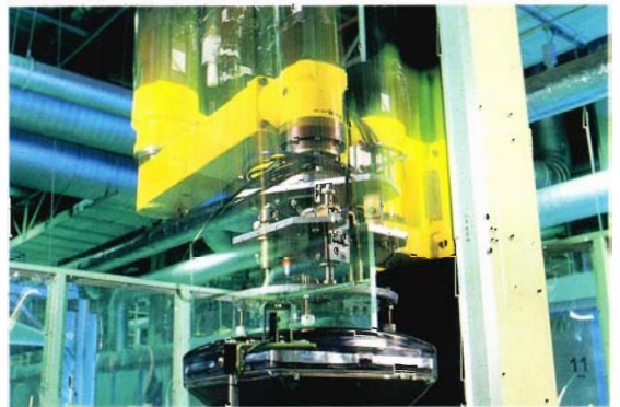
บริษัทสยามคอมเพรสเซอร์อุตสาหกรรม ติดตั้งเครื่องจักรเพิ่มเติม เพื่อขยายกำลังผลิต เพิ่มเป็นปีละ 650,000 เครื่อง

กิจการยางและอุปกรณ์ยานยนต์ ในปี 2536 บริษัทยางสยาม และบริษัทยางสยามอุตสาหกรรม ได้ขยายกำลังผลิตยางรถจักรยานยนต์ ยางรถบรรทุกขนาดเล็กและขนาดใหญ่ เพื่อเพิ่มส่วนแบ่งตลาด บริษัทสยามอัลลอยวีลอุตสาหกรรม ได้เริ่มผลิตกระทะล้ออะลูมิเนียมอัลลอยตั้งแต่เดือนพฤษภาคม 2536 ส่วนบริษัทสยามฟรุ๊กว่าวแบดเตอร์ ได้ขยายกำลังผลิตแบดเตอร์สำหรับรถยนต์และรถจักรยานยนต์แล้วเสร็จ พร้อมทั้งมีแผนที่จะขยายกำลังผลิตแบดเตอร์รถยนต์เพิ่มขึ้นอีก เพื่อให้เพียงพอกับความต้องการของตลาดที่ยังคงขยายตัวอย่างต่อเนื่อง