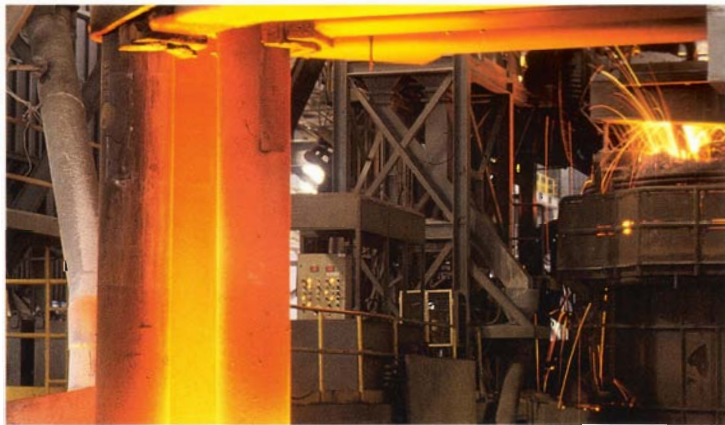
โรงงานบริษัทเหล็กก่อสร้างสยามที่ จ.ระยอง ได้ดำเนินการผลิตเหล็กเส้นก่อสร้างแล้วในปี 2536

กิจการสินค้ากระจกและไฟเบอร์กลาส บริษัทกระจกสยามการ์เดียน เริ่มผลิตสินค้าในปี 2536 ซึ่งมีผลการดำเนินงานเป็นที่น่าพอใจ บริษัทได้เริ่มสร้างเครือข่ายการจัดจำหน่ายทั่วประเทศ เพื่อแข่งขันกับผู้ผลิตเดิมและแข่งขันกับการนำเข้า ในขณะเดียวกัน ยอดการส่งออกของบริษัทก็เพิ่มขึ้นตามลำดับ เนื่องจากคุณภาพผลิตภัณฑ์เป็นที่ยอมรับในต่างประเทศ ส่วนบริษัทสยามไฟเบอร์กลาสเริ่มผลิตและจำหน่ายสินค้าในปี 2536 และยังคงอยู่ในช่วงแนะนำผลิตภัณฑ์ท่อเสริมใยแก้วซึ่งเป็นสินค้าใหม่