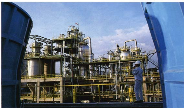
บริษัทไทยโพลิโพรไพลีน เริ่มผลิตเม็ดพลาสติกโพลิโพรไพลีน (PP) ได้ในปี 2536

ความต้องการของตลาดในปี 2536 เพิ่มขึ้นจากปี