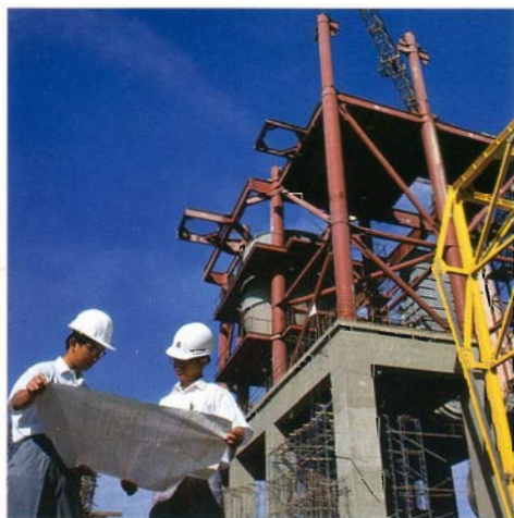
หม้อเผาใหม่ในบริเวณโรงงานปูนซีเมนต์แก่งคอย จ.สระบุรี

อย่างทั่วถึงและทันกาล มีการประกอบ Batching Plant ให้เหมาะกับสภาพกรใช้งาน และได้นำระบบคอมพิวเตอร์เข้ามาใช้ เพื่อเพิ่มประสิทธิภาพในการผลิตให้ดีขึ้น