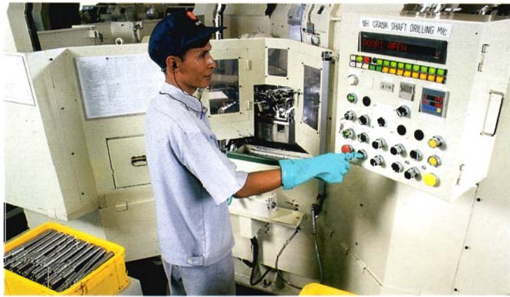
บริษัทไทยซีอาร์ที ได้ขยายกำลังผลิตหลอดภาพโทรทัศน์สีเป็นปีละ 2 ล้านหลอด

กิจการยางและอุปกรณ์ยานยนต์ การขยายตัวอย่างต่อเนื่องของตลาดรถยนต์ โดยเฉพาะรถยนต์นั่ง ทำให้มูลค่าการจำหน่ายยางสยามไทร์และยางมิชลินเพิ่มขึ้นจากปีที่ผ่านมา ส่วนแบตเตอรี่รถยนต์และแบตเตอรี่รถจักรยานยนต์ก็มีแนวโน้มยอดขายเพิ่มขึ้น เนื่องจากคุณภาพเป็นที่ยอมรับของตลาดมากขึ้นโดยลำดับ บริษัทยางสยามมีนโยบายเพิ่มส่วนแบ่งตลาดในตลาดทดแทนสำหรับยางรถยนต์นั่ง ยางรถบรรทุกเล็กและยางรถบรรทุกขนาดใหญ่ ตลอดจนขยายตลาดสำหรับผลิตภัณฑ์ใหม่ ซึ่งได้แก่ ยาง