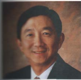
จุฬาลงกรณ์มหาวิทยาลัย กรรมการผู้จัดการใหญ่